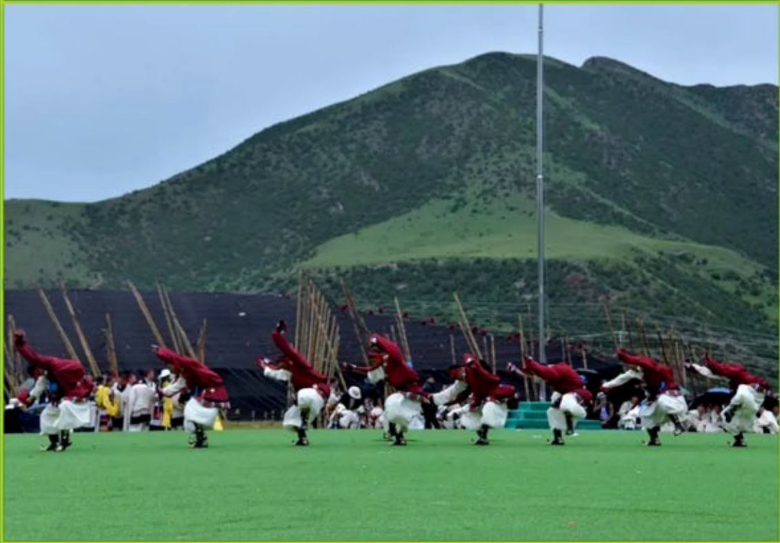
འཕྲི་རུ་ཚོང་སྲུང་པ་ནགས་ཤོད་རིག་གནས་ཡུལ་སྐོར་སྐུ་ཅལ་དུས་ཆེན་དང་དབྱར་རྩ་དགུན་འབྲུའི་ཚོང་འདུས་སྐབས་ཀྱི་ཞབས་ཤོ།