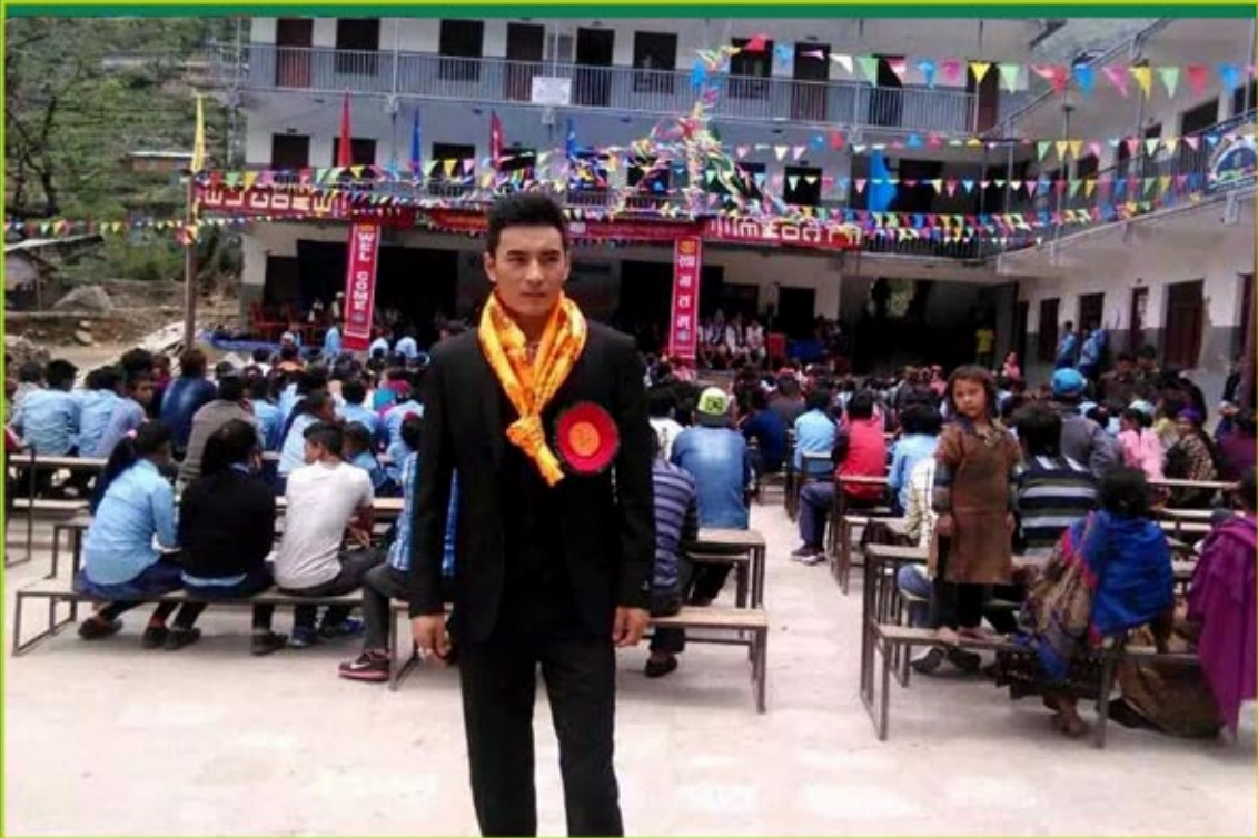
སའེན་དཔོན་དང་ལྷག་བསམ་གྱིས་ཕྱག་ལ་ཉམ་ཐག་དུ་བྱག་སང་པོའི་ལ་ས་ལྷ་བྱ་བལ་ཡུལ་གནས་བཞུགས་དཀོན་མཚོག་བཟ་ཤིས་ལགས་ཀྱིས་ནགས་ལྗེའི་སྐོན་མེ་འདོན་ རེངས་བཅུ་གཉིས་པའི་འགྲོ་གྲོན་ཆ་ཚང་གནང་བྱང་བས་སྤོང་ནས་ཐུགས་རྗེ་ཆེ་ལྟ།